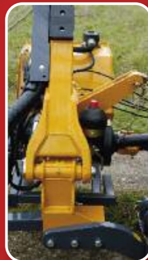
Articulations des bras estampés.