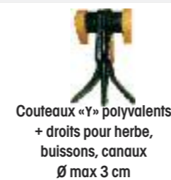
Couteaux «Y» polyvalents + droits pour herbe, buissons, canaux Ø max 3 cm