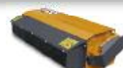
TIM 110 Poids : 133 kg