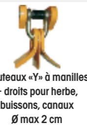
Couteaux «Y» à manilles + droits pour herbe, buissons, canaux Ø max 2 cm