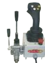
* avec option commande électrique monolevier « ELECTRA »