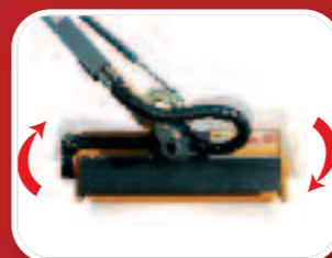
Système floating. Rouleau palpeur réglable 3 positions.