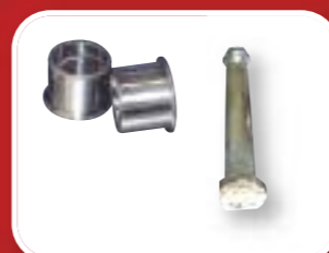
Axes traités montés sur bagues bi-métal épaulées avec graisseurs.