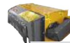
TI 100 Poids : 175 kg